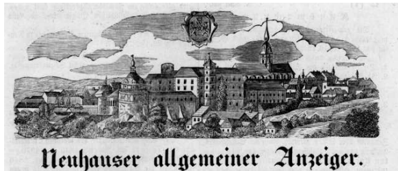
HLAVIČKA JINDŘICHOHADECKÉHO PERIODIKA, KTERÉ VYCHÁZĚLO V LETECH 1844 – 1848

V knihovně Muzea Jindřichohradecka jsou zájemcům o studium zpřístupňována periodika vztahující se oborům historie, archeologie, etnografie, umění, ochrany památek, knihovnědy a muzeologie. Z bohaté nabídky nově odebrávaných titulů jmenujeme například Archeologické rozhledy, Archeologické památky, Český časopis historický, Dějiny a současnost, Soudobé dějiny, Časopis Národního muzea, Český lid, Ateliér, Umění a další. V regionálních titulech jsou to například Archeologické výzkumy v jižních Čechách, Jihočeský sborník historický, Výběr (časopis pro historii a vlastivědu jižních Čech) nebo Vlastivědný sborník Dačicka, Jindřichohradecka a Tebofska. Tuto škálu doplňují regionální noviny – deníky, týdeníky, měsíčníky, zpravodaje obcí z Jindřichohradecka a podobně. Kromě aktuálních čísel, která jsou přístupná volně v badatelné muzea v budově bývalého kláštera minoritů ve Štítného ulici 124/I, se ve fondech knihovny nacházejí i starší svázané ročníky. Mnohdy se jedná o ucelené řady, jež začaly vycházet už v hluboké minulosti, jako je tomu například u Časopisu Národního muzea, jehož první ročník vyšel v roce 1827 a je též uložen v našich fondech. Naši